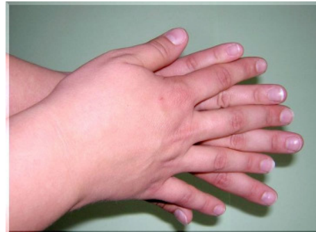
Schritt 2: Rechte Handfläche über linkem und linke Handfläche über rechtem Handrücken reiben