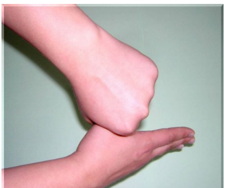
Schritt 5: Einreiben des rechten und linken Daumens