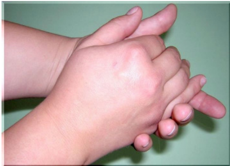
Schritt 1: Handfläche auf Handfläche reiben

Standard – Einreibemethode für die hygienische Händedesinfektion