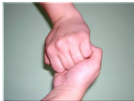
Schritt 4: Außenseite der Finger auf gegenüberliegenden Handflächen mit verschränkten Fingern reiben